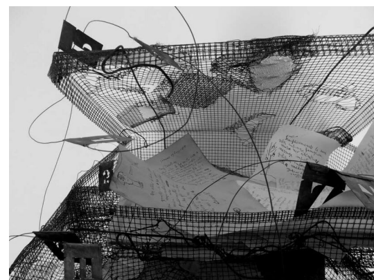
Paola Paganelli - Lettere